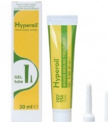
Onderhoudsfase 30 ml GEL tube