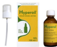
100 ml GEL spray