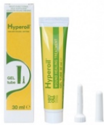
30 ml GEL tube