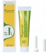
Onderhoudsfase 30 ml GEL tube