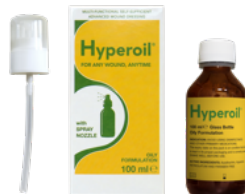
100 ml OLIE spray