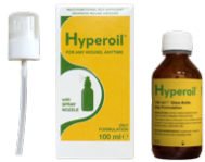
Acute fase 100 ml OLIE spray