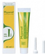
30 ml GEL tube