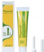
30 ml GEL tube