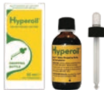
Acute fase 50 ml OLIE met druppelaar