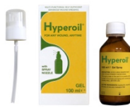
100 ml GEL spray