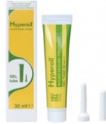
30 ml GEL tube