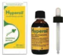
Acute fase 50 ml OLIE met druppelaar