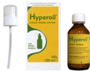
100 ml GEL spray