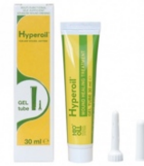
Onderhoudsfase 30 ml GEL tube