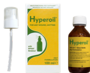
100 ml OLIE spray