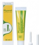
30 ml GEL tube