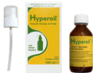
Acute fase 100 ml OLIE spray