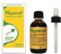
50 ml OLIE met druppelaar

Afhankelijk van het soort zweer, dat dient te worden behandeld (raadpleeg uw medisch specialist), worden de volgende Hyperoil® producten aanbevolen: