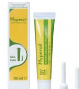
Onderhoudsfase 30 ml GEL tube