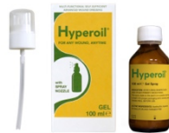
100 ml GEL spray