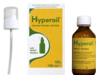
100 ml GEL spray