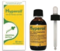
Acute fase 50 ml OLIE met druppelaar